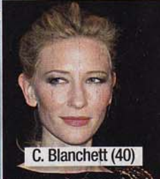
C. Blanchett (40)