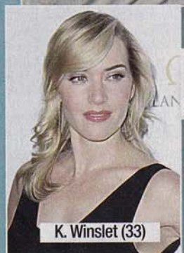
K. Winslet (33)

Rachel Weisz provoca Hollywood: basta con il mondo finto degli attori rifatti. Da noi, il successo di un documentario on line rilancia la sfida a Ventura, Parietti, Perego: ribellatevi alla schiavitù dell'eterna giovinezza