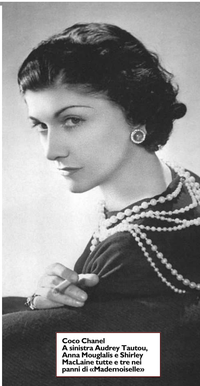
Coco Chanel A sinistra Audrey Tautou, Anna Mouglalis e Shirley MacLaine tutte e tre nei panni di «Mademoiselle»